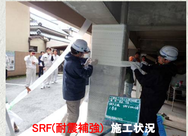
SRF(耐震補強) 施工状況