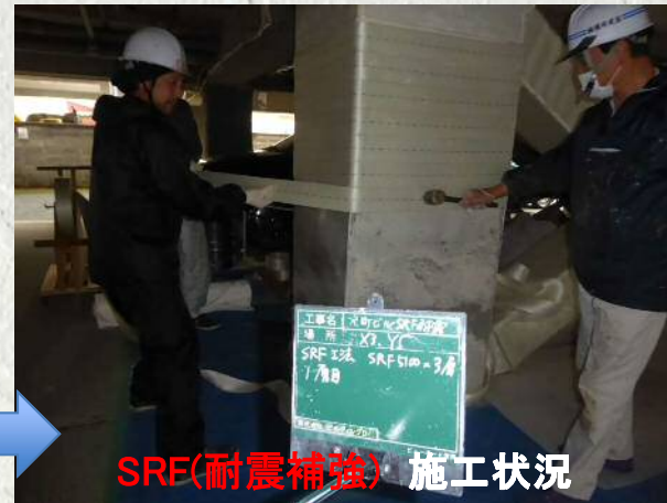
SRF(耐震補強) 施工状況