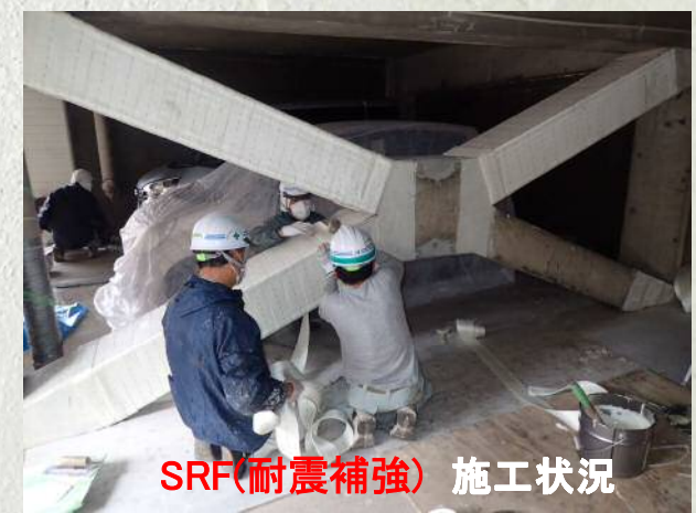
SRF(耐震補強) 施工状況